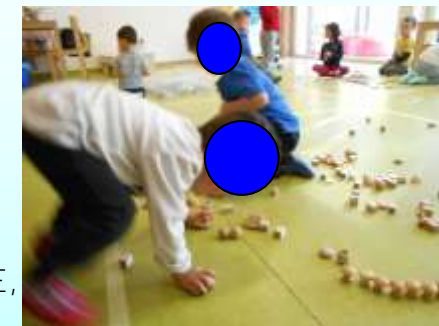
LEGNETTI, PIGNE, GHIANDE, TAPPI