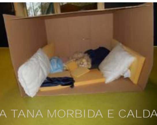
LA TANA MORBIDA E CALDA