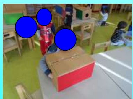
LE SCATOLE MISTERIOSE : INDOVINA COSA TOCCHI ?