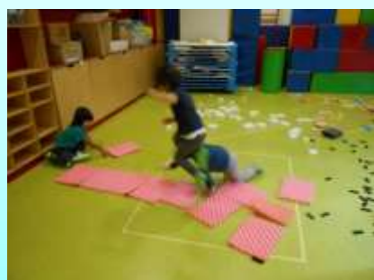
SPUGNE, STOFFA, PELLICCIA, GOMMA PIUMA E TANTO ANCORA