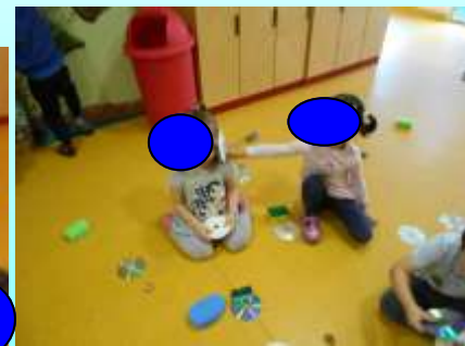
FERRO, CHIAVI, PAGLIETTE, CD PER SENTIRE IL FREDDO IL LISCIO E IL RUVIDO