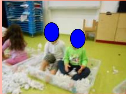
TAPPI DI PLASTICA